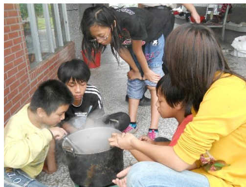
圖二：將綁好圖樣的棉麻布放在染料進行染煮

為了傳承阿美族草木灰與植物染文化，帶著孩子跟著耆老上山砍柴。木柴完全陰乾後，經過祖靈託夢而選定地點，選擇乾燥晴天的日子染布（見圖一）。染布地點在溪岸或空曠地，先煮染材，利用不同溫度的水，將天然植物色素充分溶解，行程濃縮液，做成染液（見圖二）。將棉麻布綁成所要的圖樣。基本的準備工作完成，燒柴點火前，所有參與人員先一起祭祀祖靈，驅趕邪惡靈（阿美族語 mifetik），以保佑染布成功。但是前晚有做惡夢者、放屁、打嗝、打噴嚏者，不得參加。