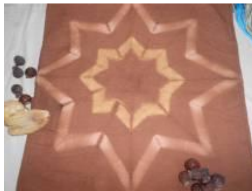
圖七：用熟曬的薑黃、檳榔萃取植物色素染出獨特的顏色