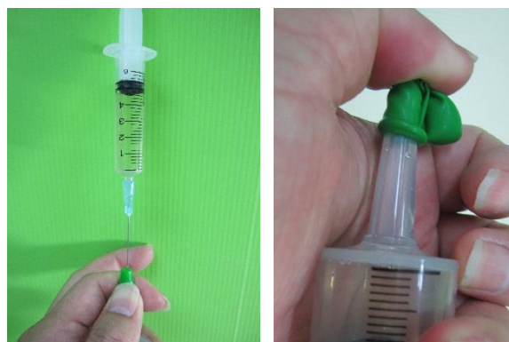
圖四：準備注入食用醋（左）；注入完畢用大拇指緊壓開口（右）