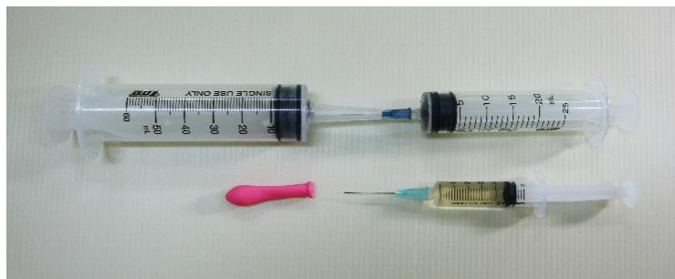
圖一：亞佛加厥定律的定量實驗裝置

本實驗設計的亞佛加厥定律之定量實驗係以針筒和氣球製組合成一個反應產生氣體的密閉系統，並以食用醋及小蘇打粉作為產生的氣體來源，此二物質為沒有毒性的常用食品，且反應不會發生危險。