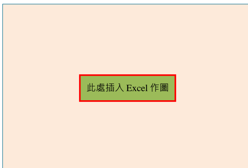
圖五：針筒內部在各刻度處的摩擦力所造成的體積差