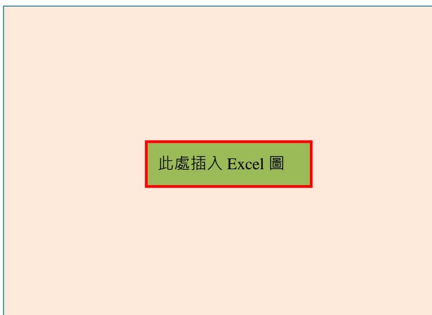
圖六：二氧化碳體積乘以毫莫耳數對其毫莫耳數作圖