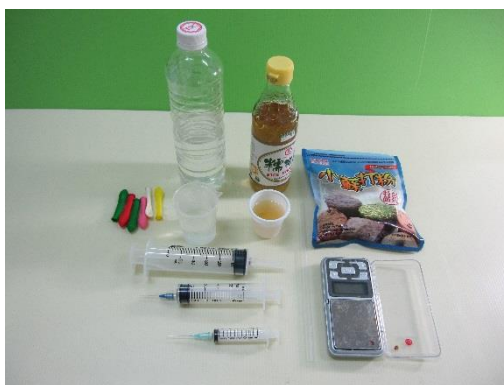
圖二：亞佛加厥定律的定性實驗需用藥品和器材

塑膠注射針筒（50 mL, 25 mL 或 10 mL, 5 mL，後兩者含針頭）各一支、小蘇打粉（碳酸氫鈉）1.0 g、食用醋 50 mL、小型氣球 2~4 個、攜帶式電子天平（精稱到 0.01 g）一台、廚房用量杯（100 mL）、塑膠杯（或試飲杯）1 個，如圖二所示。