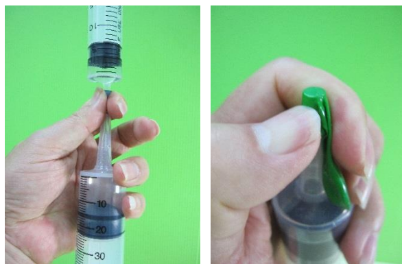
圖四：碳酸氫鈉溶液（左）；套住小氣球在針筒的開口處（右）