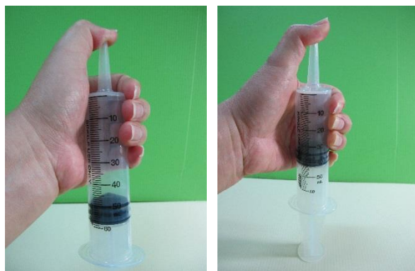
圖三：先移動推拉桿到固定的刻度線（左）；再用力擠壓推拉桿（右）