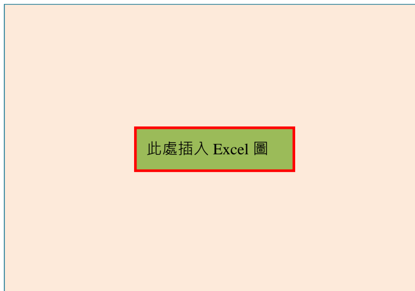
圖五：二氧化碳毫莫耳數與其體積的關係