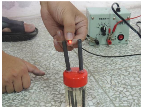
圖 6：燃料電池實驗裝置

電能轉換成光能等，體驗除了電能的方便性外，同時讓學習者瞭解能源轉換效率 ( 產生熱能 ) 的相關問題，讓學習者瞭解能源常在