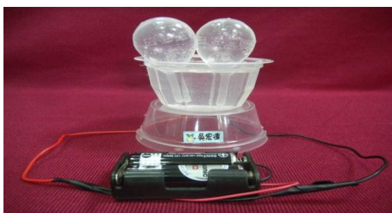
圖 5：挽腸盒裝滿硫酸鎂溶液 (左) 和挽腸盒倒插入塑膠盒 (右)