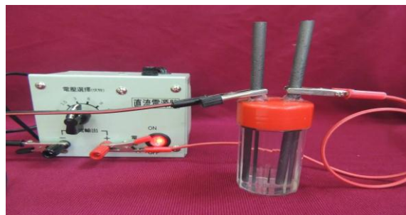
圖 7：2 支碳棒插入蓋子(左)和利用電源供應器進行電解(右)