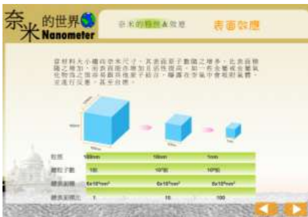
圖 2：一般傳統奈米化學學習模式