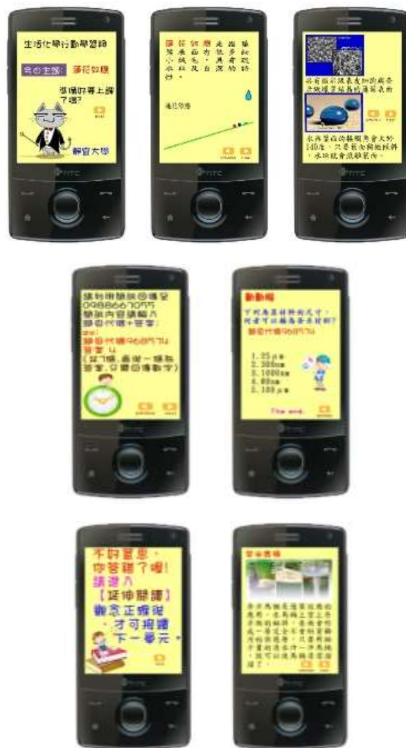
圖 3：行動學習奈米化學模式

我們將精熟學習模式的理念融入基本教學模式，結合學習、評量與回饋、充實或補救的教學歷程，於每一個小單元的學習完畢後，全部學習者接受小測驗的評量，如學習者在該測驗上的答對率達到教學者事先預訂的精熟標準者，即被視為精熟學習者，教學者便可針對這些學習者進行充實活動的措施，以維繫其精熟的程度；若評量結果未達精熟標準者，即被視為學習不夠精熟，便會給予個別化的補救教學，以矯正其學習錯誤的地方，矯正之後，必須再接受一次小測驗