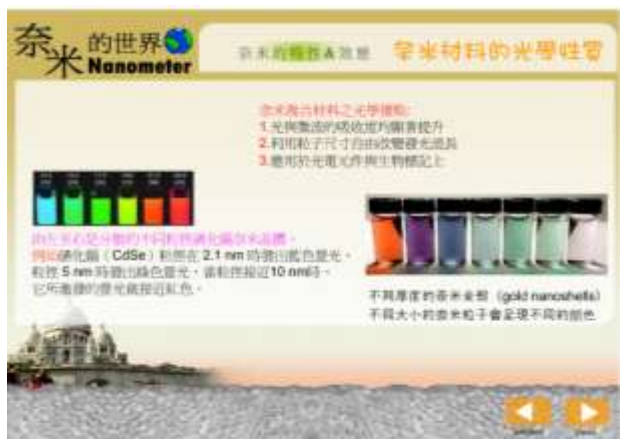
圖 2：傳統奈米化學學習

主要內容以生活化學中較新穎的「奈米化學」知識為教材內容，並依據奈米化學相關文獻、參考自然科學相關書籍與網路資料，在傳統學習內容的設計上是以文字&圖片&動畫呈現學習內容外，在介面的設計也盡量以柔和的背景與鮮明的色彩來吸引學習者的興趣，如圖 2 (三張圖) 所示。